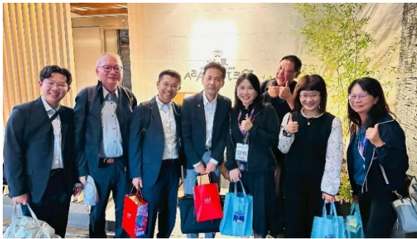
当連盟との意見交換会

今回の来県視察を踏まえ、台湾市場からの教育旅行誘致につながるよう積極的に取り組んでまいります。