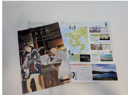
映画『きみの色』ロケーションマップ