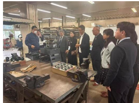
長崎工業高校（授業見学）