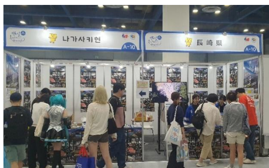
長崎県ブースの様子

今後も現地観光展などを活用し、長崎～ソウル線の利用並びに実際の来訪につながるよう積極的に取り組んでまいります。