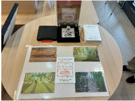
長崎駅構内観光案内所ポストカード設置の様子