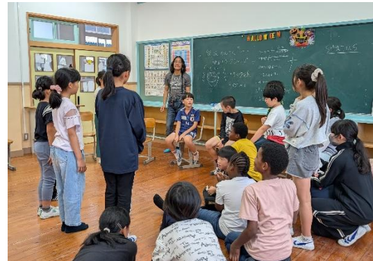
小学校での演劇ワークショップの様子