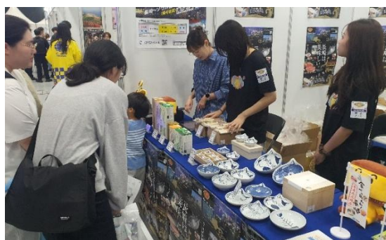
カステラ、波佐見焼等の販売