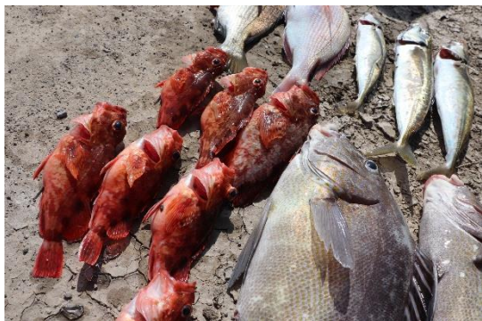
大村湾フィッシング（船釣り）

季節に応じた釣りスポットへご案内し、初心者でも手ぶらで気軽に楽しめる「大村湾フィッシング」。長崎空港（大村市）や片島魚雷発射試験場跡（川棚町）、西海橋（西海市）や針尾無線塔（佐世保市）など広域を周遊する「大村湾プライベートクルーズ」。9市町にまたがる大村湾ならではのマリンアクティビティを体験してみませんか。