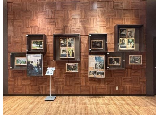
みらい長崎ココウォークでの展示