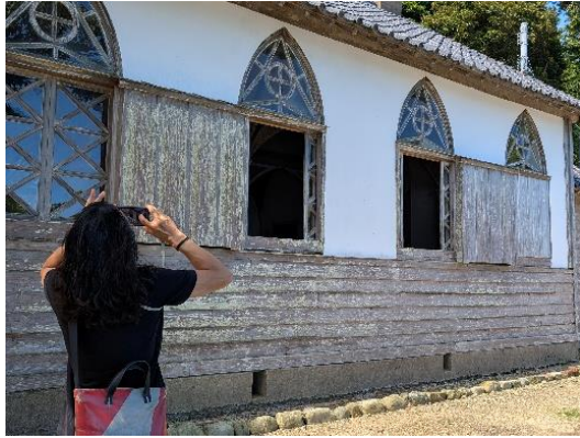
五島市シナハンの様子