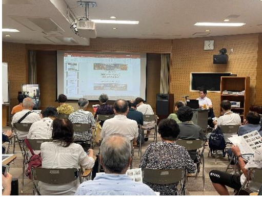
公民館講座の様子