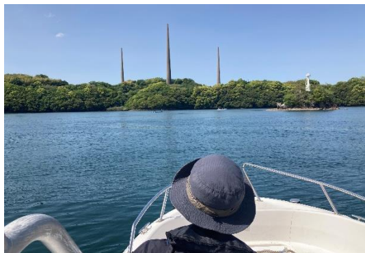
大村湾プライベートクルーズ