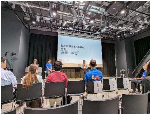
第1部 協議会実績報告の様子

ロケ支援の取り組みに加え、作品を活用したプロモーション活動にも引き続き力を入れてまいります。