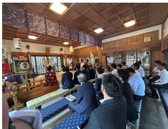
壱岐神楽見学の様子