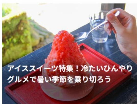
アイススイーツ特集