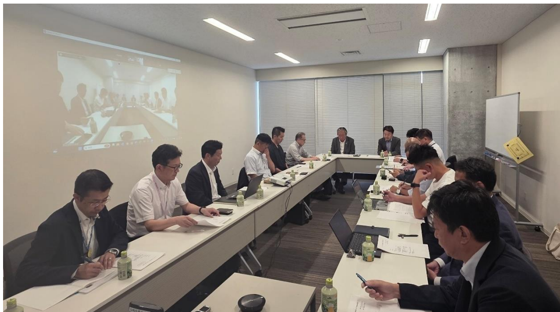
第1回インバウンド委員会の様子

令和7年5月16日（金）、本県のインバウンド推進に関して、現状や課題等の情報共有をはじめ、課題解決に向けた企画検討や関連施策の効果的な推進などを通じて、更なる賑わいを創出し、本県観光産業の発展に寄与することを目的に、定款第38条による専門委員会として、「インバウンド推進委員会」を設置しました。