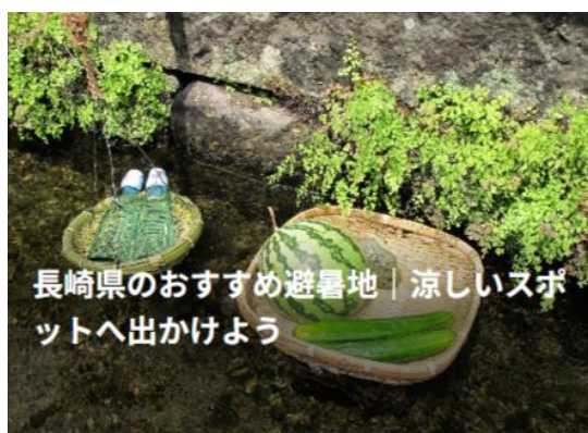
長崎県のおすすめ避暑地