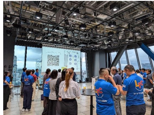
第2部 情報交換会の様子