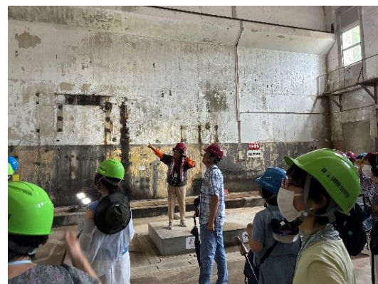
針尾送信所の様子