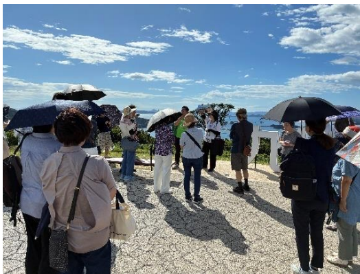
九十九島観光公園の様子

今後も県内市町と連携をしながら、ロケツーリズムにつながる取り組みを推進してまいります。