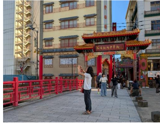
長崎市シナハンの様子