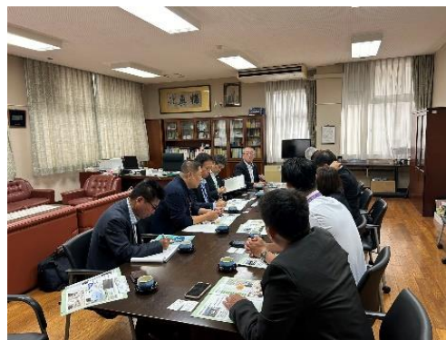
猶興館高校との交流の様子