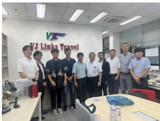
ホーチミンの旅行社セールス