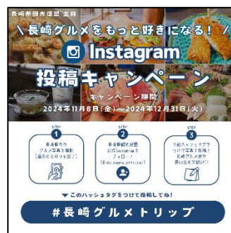
キャンペーン告知画像

投稿いただいた方の中から抽選で、県内ホテルのペア宿泊券や県産品のプレゼントを予定していますので、会員の皆様方も、是非、ご参加下さい。