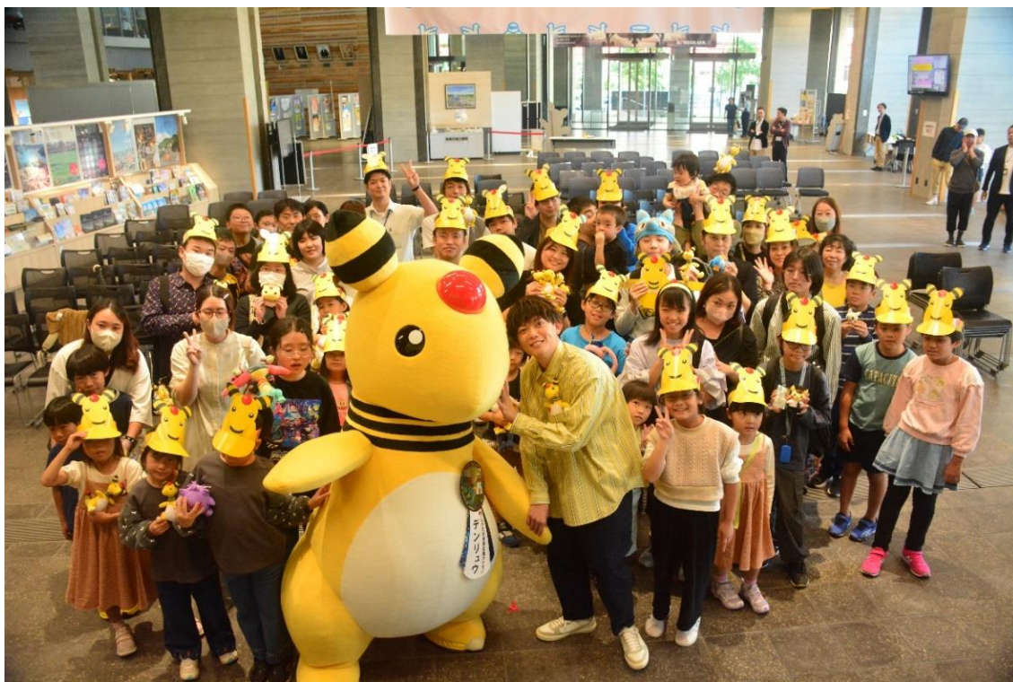
松丸亮吾さん・デンリュウ・参加者との記念撮影

11月1日（金）から開始したスタンプラリー「ながさき照らす旅」のスタートを記念して、11月4日（月・振休）、謎解きクリエイターやポケモン好きとして、テレビ番組等で活躍されている松丸亮吾氏を招き、発表会を行いました。