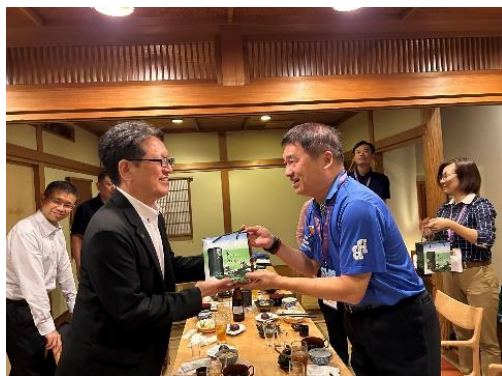
当連盟との意見交換会の様子

今回の来県視察を踏まえ、台湾市場からの教育旅行誘致に繋がるよう積極的に取り組んでまいります。