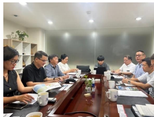
ハノイの旅行社セールス