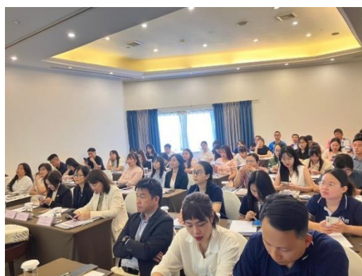
ハノイ観光説明会