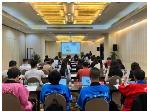
ホーチミン観光説明会

上記2市とも福岡への直行便が運航しており、今後も福岡イン・アウトによるベトナムから本県への誘致に努めてまいります。