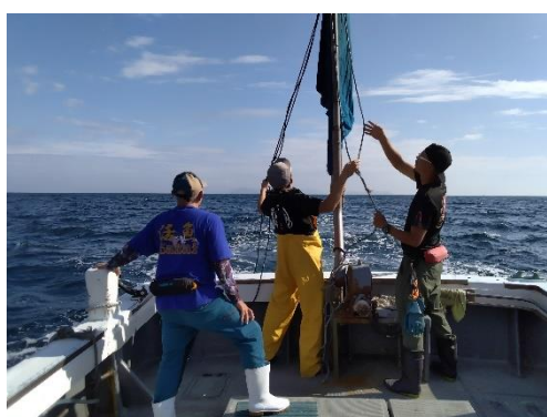
野母崎地区でのロケの様子