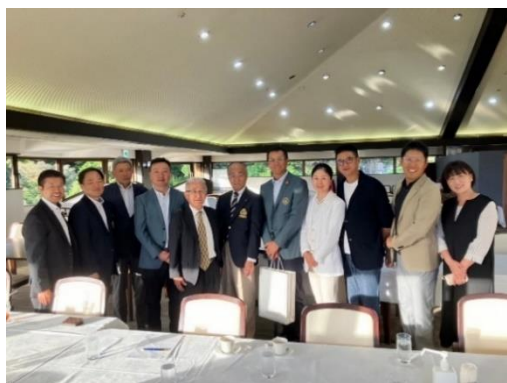
上海ゴルフ協会と長崎県ゴルフ協会との交流

今後とも、県内の観光関係者と連携しながら、中国東方航空長崎～上海路線を活用した中国からの富裕層誘客にも注力して参ります。