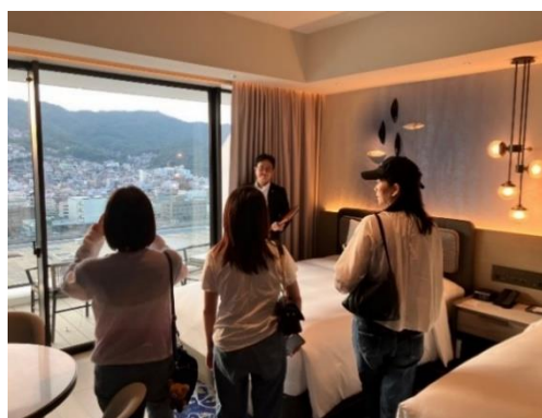
富裕旅行取扱う旅行社が高級ホテルを視察