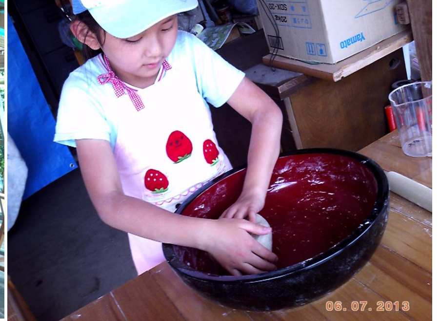
▲そば打ち体験(くくり)