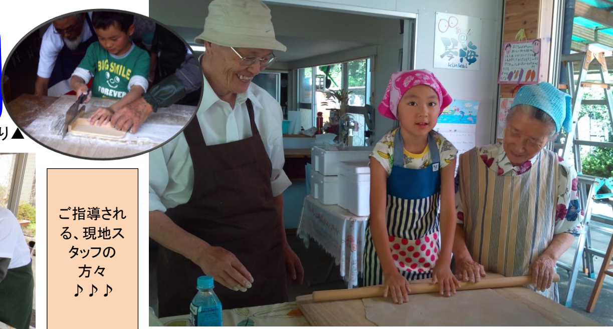
▲そば打ち体験(麵棒のばし)