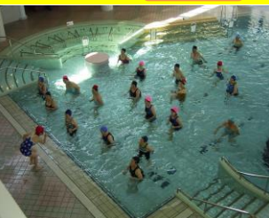
▲1 海水浴施設「いやしの湯」 高島の綺麗な海水を30℃ほどに温めたプールでタラソテラピー(海洋療法)を体験頂けます。 (水着、水泳帽着用です)