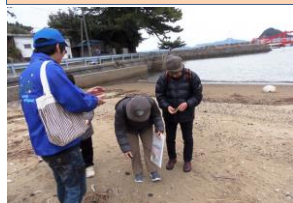
▲自然と環境にも触れながらウォーク