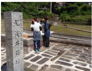
▲北溪井抗(ほかけいせいこう跡)