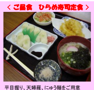
平目握り、天婦羅、にゅう麵をご用意 ※お客様はカレーライスとなります

■行程表 (行程表内マークの見方 ==バス ==船 ...徒歩 ☆入場観光 ★入場(有料)観光 *車窓観光 OP:オプション/別途料金