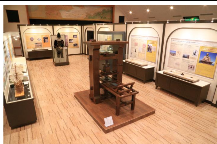
▲有馬キリシタン遺産記念館(館内)

長崎観光バス(白色カラー)が路上で待機 添乗員・スタッフが受付します 集合 7:50(時間厳守)