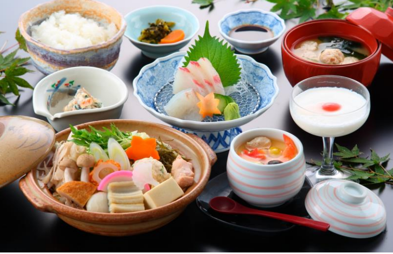
▲ご昼食/真砂御膳(小学生はお子様ランチ)