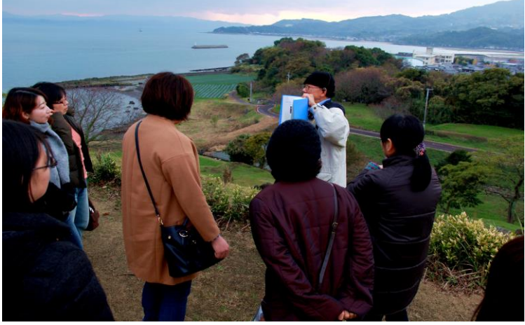
▲原城跡(現地ガイドがご案内)