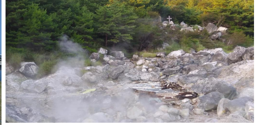
▲雲仙地獄谷(殉教の地)