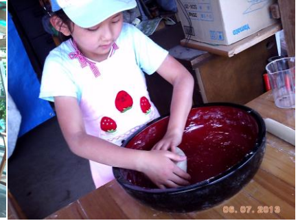
▲そば打ち体験(くり)