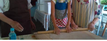
▲そば打ち体験(麺棒のばし)